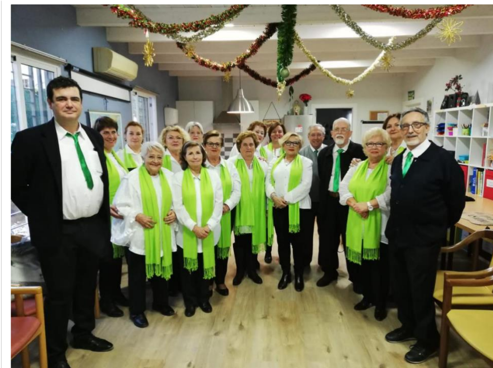
Primera actuación del Coro en el Desayuno navideño de ASALBEZ

En el seno de la Asociación de Cuidadores y Enfermos de Alzheimer Bezmiliana (ASALBEZ) se decide crear allá por el año 2018, un grupo “Músico Vocal” con usuarios, socios y colaboradores de esta asociación, cuya finalidad es servir como terapia y disfrute musical, a fin de recordar canciones de ayer y de hoy.