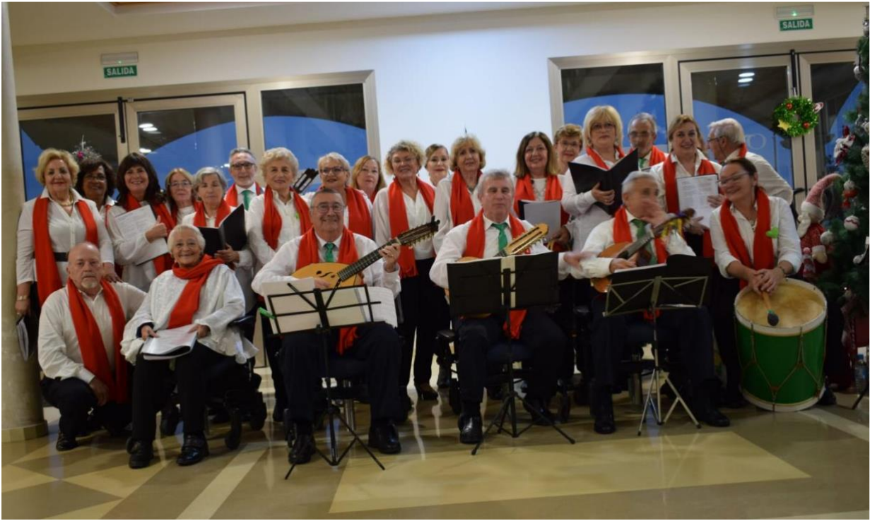
Residencia de Mayores ORPEA, Añoreta.